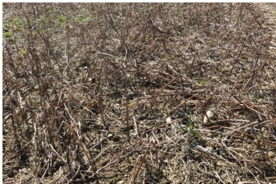
Abb.: Abgefrorene Zwischenfrüchte: Gelbsenf (oben) hinterlässt helles Material während ein Gemenge, das u.a. Phacelia und Leguminosen enthält, dunkles Material hinterlässt. Hier erwärmt sich der Boden im Frühjahr schneller. Die Mulchschicht bieten in beiden Fällen Nahrung für Regenwürmer und andere Zersetzer.