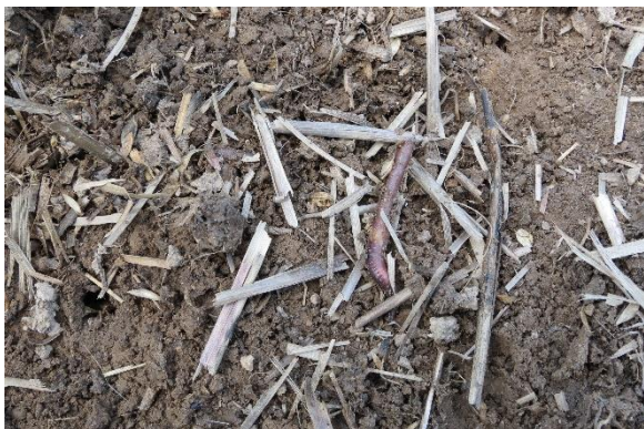
Abb.: Wer die Möglichkeit zur Mulch- oder Direktsaat hat, kann das Bodenleben aktiv fördern. Dieses Bild entstand Ende Mai 2020 auf einer Fläche, die nur 2 cm bearbeitet wurde. Nach wochenlanger Trockenheit – die Krume der Nachbarflächen waren nahezu ausgetrocknet – tummelten sich unter der Mulchschicht Regenwürmer und die Erde war komplett durchfeuchtet.

Durch die Beschattung der Flächen verhindern Zwischenfrüchte ein Austrocknen der obersten Bodenschichten (geringere Evaporation) sowohl während ihres Wachstums als auch als Mulchschicht im Frühjahr. Im Gegenzug steigt zwar die Wasserverdunstung durch die Pflanzen (Transpiration), allerdings ist die Transpiration bei den meisten Sorten wesentlich geringer als die Verdunstung über dem freiliegenden Acker. Außerdem fangen Zwischenfrüchte erhebliche Tau-mengen auf.