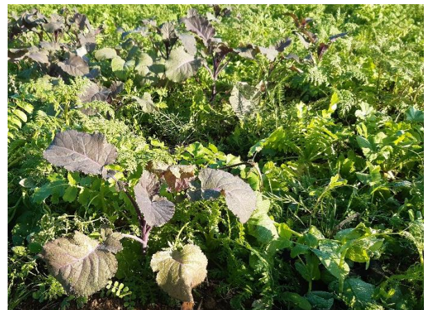
Abb.: Eine für den Silomais entwickelte Zwischenfruchtmischung. Die Mischungspartner nutzen den Platz durch unterschiedlichste Wuchsformen optimal aus und behindern sich dabei nicht.